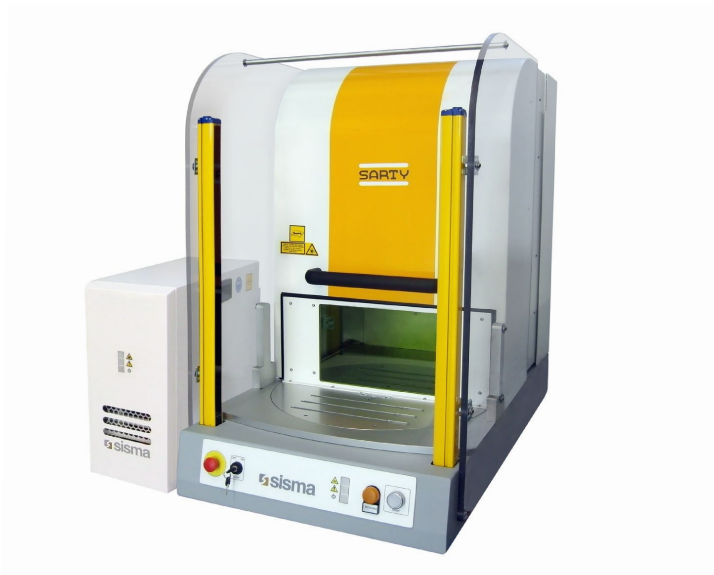
Laser marking and engraving system. Sistema di marcatura e incisione laser.