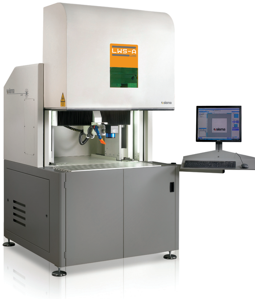
Laser marking stations with three axes Stazioni di marcatura laser a tre assi